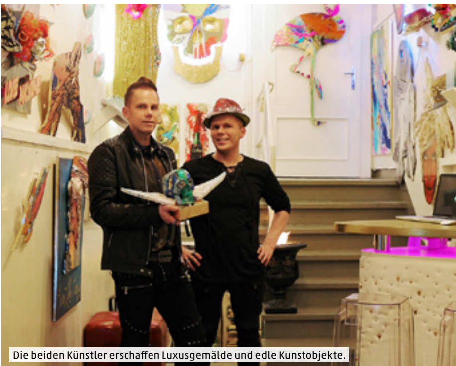
Die beiden Künstler erschaffen Luxusgemälde und edle Kunstobjekte.